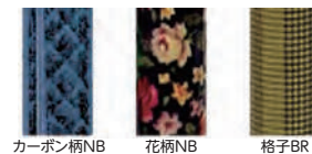
カーボン柄NB 花柄NB 格子BR

超軽量(400g)オールカーボン四点式、小柄な方にも対応できる最低高60.5cm。